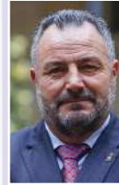
EDUARDO MORÁN PACIOS PRESIDENTE DE LA COMISIÓN DE DEPORTES Y OFICIO DE LA FEMP

EN resumen, como no podía ser de otro modo, el monumental impacto de la crisis del Covid-19 también ha trastocado todo lo relacionado con el deporte en todos sus niveles. Pero la esperanza está, en este momento, en trabajar unidos para salir de esta situación lo antes posible con el fin de retomar un trabajo que, ahora más que nunca, tiene que redundar en beneficio de la salud de las personas que habitan nuestros pueblos y ciudades. El deporte volverá a nuestros pabellones.