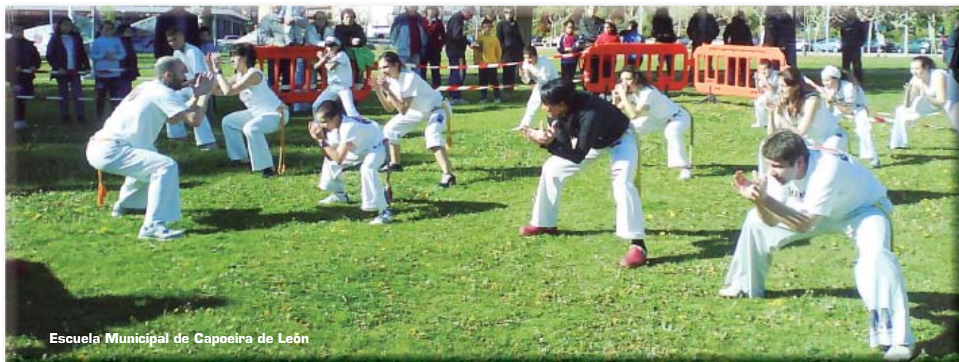
Escuela Municipal de Capoeira de León