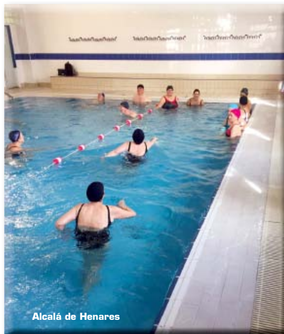
Alcalá de Henares

En cuanto a las mejoras que están obteniendo, destacó "una mayor flexibilidad, fuerza, agilidad y, sobre todo, una mejor interrelación entre ellos. La relación personal entre los participantes es mucho mejor que al principio de la temporada. Estamos muy contentos porque desde la primera evaluación a ésta se han notado muchos cambios. Una de las cosas más importantes es que los alumnos tienen