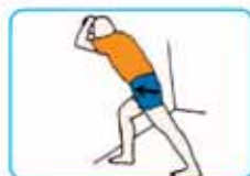
30 segundos cada pierna