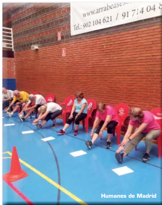
Humanes de Madrid

muy interiorizado el objetivo de estas evaluaciones e intentan superarse desde la última que les realizamos".