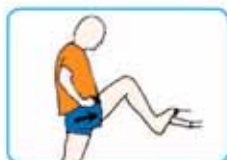
25 segundos cada pierna