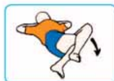
30 segundos a cada lado