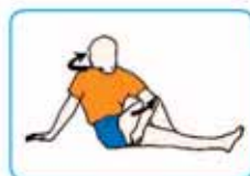
10 segundos cada lado