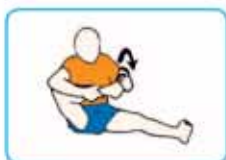
10 veces en cada dirección