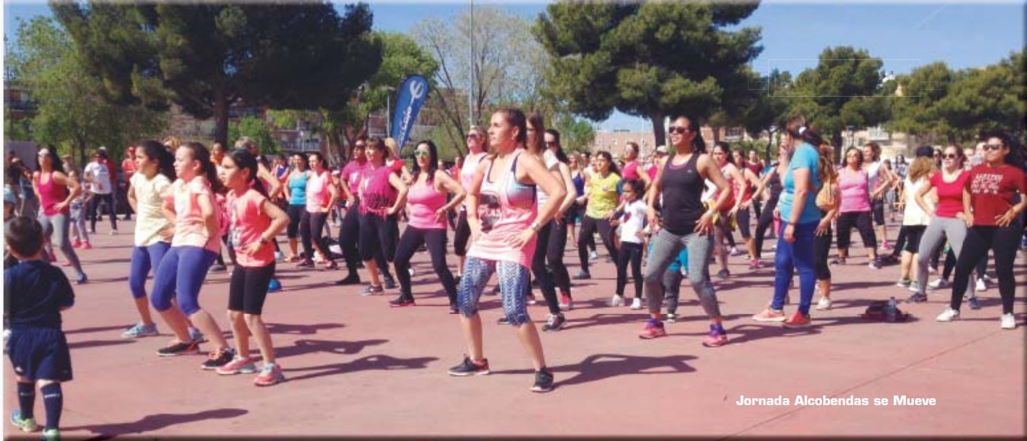
Jornada Alcobendas se Mueve