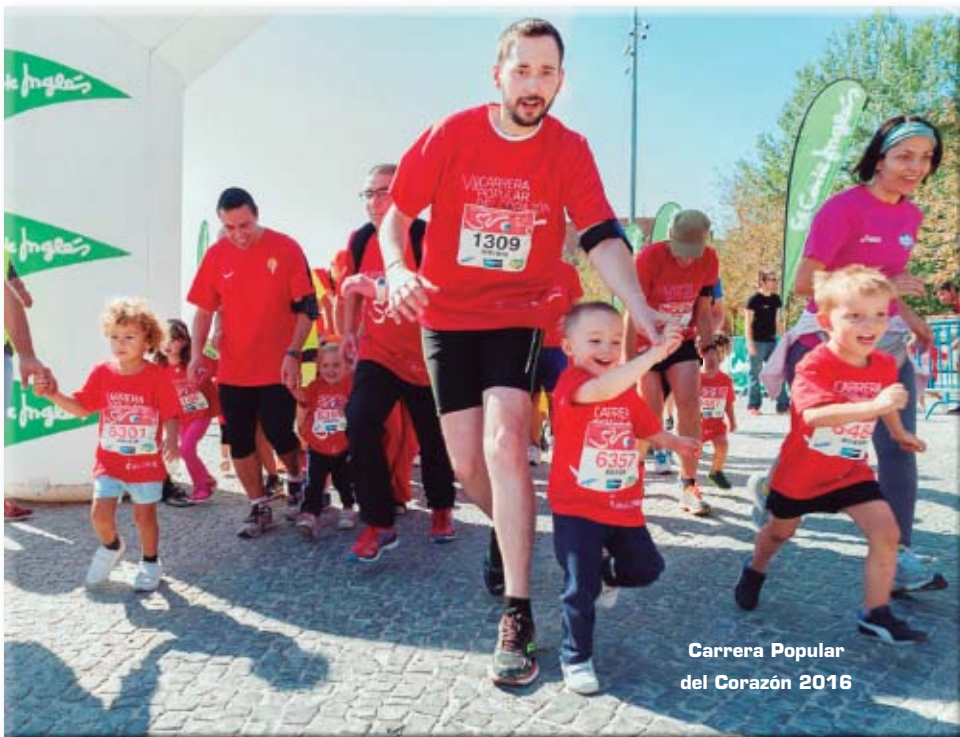
Carrera Popular del Corazón 2016

que tuvo lugar en Madrid el 16 de junio. Se entregaron diversos premios a los profesionales que destacaron en su trayectoria profesional o lograron importantes méritos en el último año. También se incluyeron categorías para investigadores y docentes.