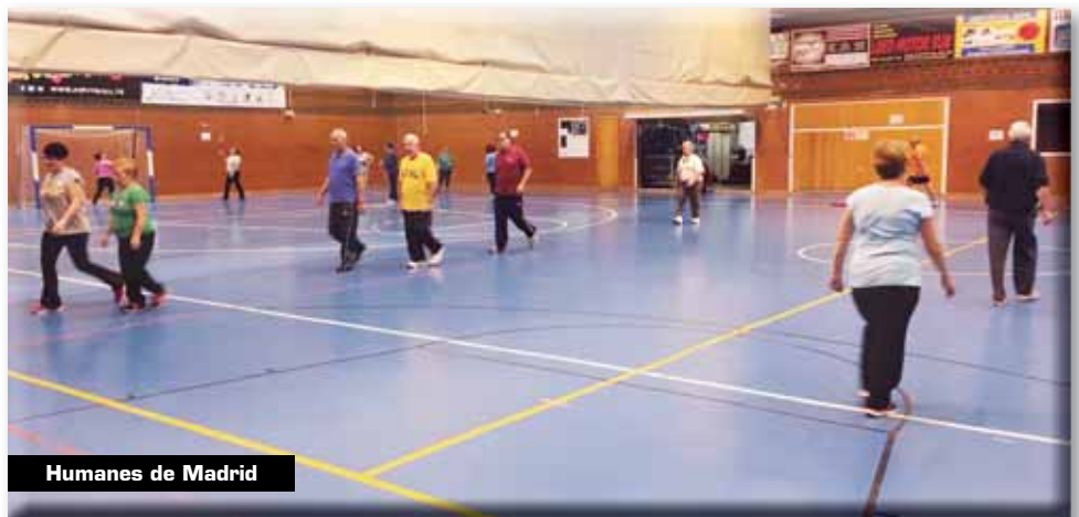
Humanes de Madrid