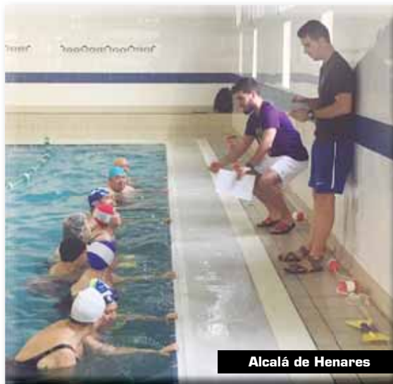
Alcalá de Henares

(representante del COPLEF de Madrid) explicó los beneficios de la práctica de actividad física en este grupo poblacional. La charla se celebró el pasado 29 de noviembre y asistieron también más de 20 personas.