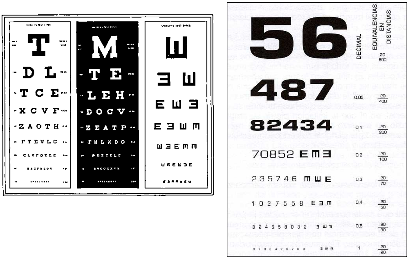
Figura 1. Tabla optóica de Snellen. Adaptado de Allen. J.H. 1979 y adaptación de la tabla de Snellen.

El procedimiento de valoración consistiría en colocar a la persona a explorar a 6 metros de distancia de la escala optóica de Snellen u otra adaptada (a esta distancia los rayos de luz casi resultan casi paralelos) y tendría que ver con total claridad la línea de letras o símbolos que corresponda a esa distancia (la séptima línea de la tabla que equivale a seis metros). Si no fuera capaz de distinguir claramente esa línea se subiría a la siguiente (9/6) y así sucesivamente hasta que la persona distinga con claridad las letras o símbolos.